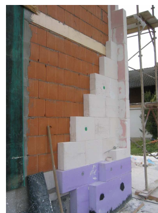
Fig. 4 – Esempi di strutture di passivhaus a differente capacità massica

L'aspetto architettonico di questi edifici è spesso caratterizzato da ampie superfici vetrate sul lato sud e da aperture di dimensione ridotta sul lato nord; ragion per cui l'orientamento di questi edifici è prevalentemente secondo l'asse Est-Ovest al fine di coprire la maggior parte del fabbisogno energetico con gli apporti solari.