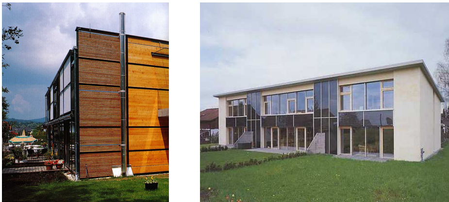
Fig. 2 – Esempi di edifici realizzati nell’ambito del Progetto CEPHEUS

L'interesse per il modello costruttivo ed energetico della passivhaus è stato anche dimostrato nell’ambito del progetto Europeo CEPHEUS (Cost Efficient Passive House as European Standard), un progetto dimostrativo iniziato nel 1998 e finalizzato alla sperimentazione e valutazione in cinque paesi europei (Germania, Svezia, Svizzera, Austria e Francia) di questo modello e che ha portato alla costruzione di 14 edifici passivi per un totale di 221 unità residenziali. Le finalità del progetto europeo consistevano essenzialmente nel valutare la praticabilità del modello di edificio passivo mantenendo gli extra - costi bassi per differenti tipologie edilizie, con differenti strategie di progettazione nei differenti paesi europei, e nell’operare un’analisi del mercato immobiliare finalizzata all’individuazione della risposta conseguente all’introduzione di questa tipologia edilizia. Il target energetico del progetto CEPHEUS è stato quello di mantenere il fabbisogno energetico globale (riscaldamento domestico, produzione di acqua calda per usi sanitari, illuminazione ed altri usi domestici) dell’edificio passivo al disotto del limite di 42 kWh/m 2 anno. I risultati del progetto sono stati presentati nell’ambito dell’esposizione di Hannover del 2000.