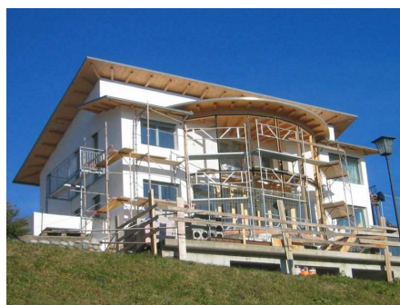
Fig. 3 – Esempi di passivhaus italiane