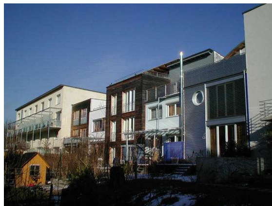
Fig. 1 – Edifici del Quartiere Vauban a Friburgo a basso consumo energetico

Un indicatore dell'efficienza energetica degli edifici che dovrà essere considerato è il fabbisogno energetico annuo riferito all'unità di superficie riscaldata dell'edificio ( \text{kWh/m}^2\text{a} ), riferito sia al solo riscaldamento che al fabbisogno globale di energia (raffrescamento, acqua calda, illuminazione, etc.). Nelle regioni climatiche caratterizzate da estati calde sarebbe infatti opportuno includere anche il fabbisogno energetico per il raffrescamento estivo che spesso è di natura elettrica; includendo inoltre il consumo energetico per l'illuminazione e per gli apparecchi elettrici, si otterrebbe un indicatore energetico complessivo.