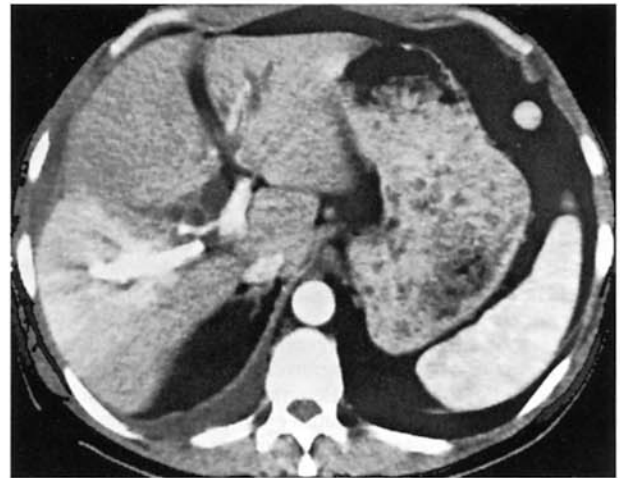
Fig. 1. — Arterializzazione del VI-VII segmento epatico nella trombosi portale acuta iatrogena. Impregnazione grossolanamente triangolare durante la fase della perfusione arteriosa.

La TC dell'addome immediatamente successiva alla trombosi conferma i reperti già noti con presenza di catetere transepatico nel ramo destro della vena porta. Nella fase contrastografica precoce è riconoscibile intensa, omogenea e fugace impregnazione del VI e VII segmento epatico, reperto non più visualizzabile durante la fase portale (fig.1).