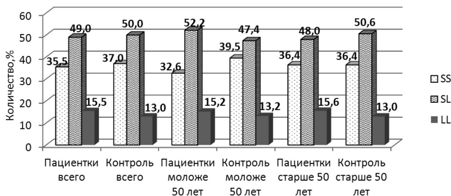
Рис. 2. Частота встречаемости аллельных вариантов (TTTA) n -полиморфизма в интроне 4 гена CYP19A1 в исследуемых группах

На следующем этапе мы провели анализ ассоциации полиморфизма в интроне 4 с риском развития РЯ.