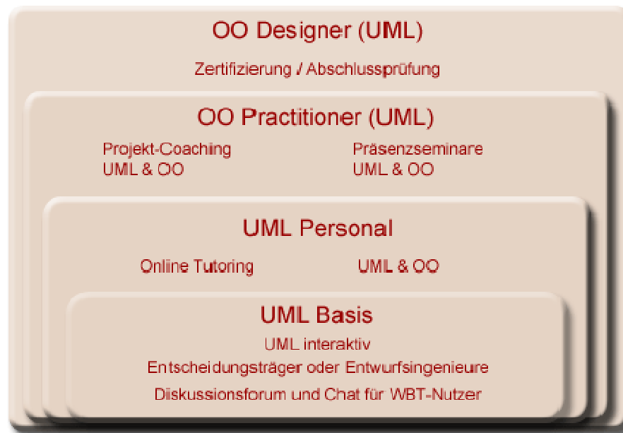
Abbildung 1: Die hierarchische Struktur der Bausteine des Baukastens "Objektorientierte Software-Entwicklung mit UML"