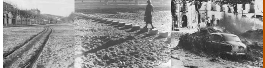
Pels rials baixa el carro del sol, des de carenes