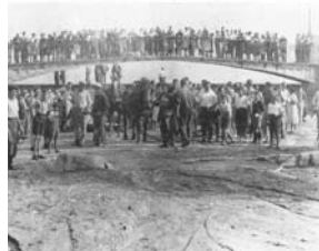
... i vinyes que jo sempre recordo. (S. Espriu, Cementiri de Sinera I)