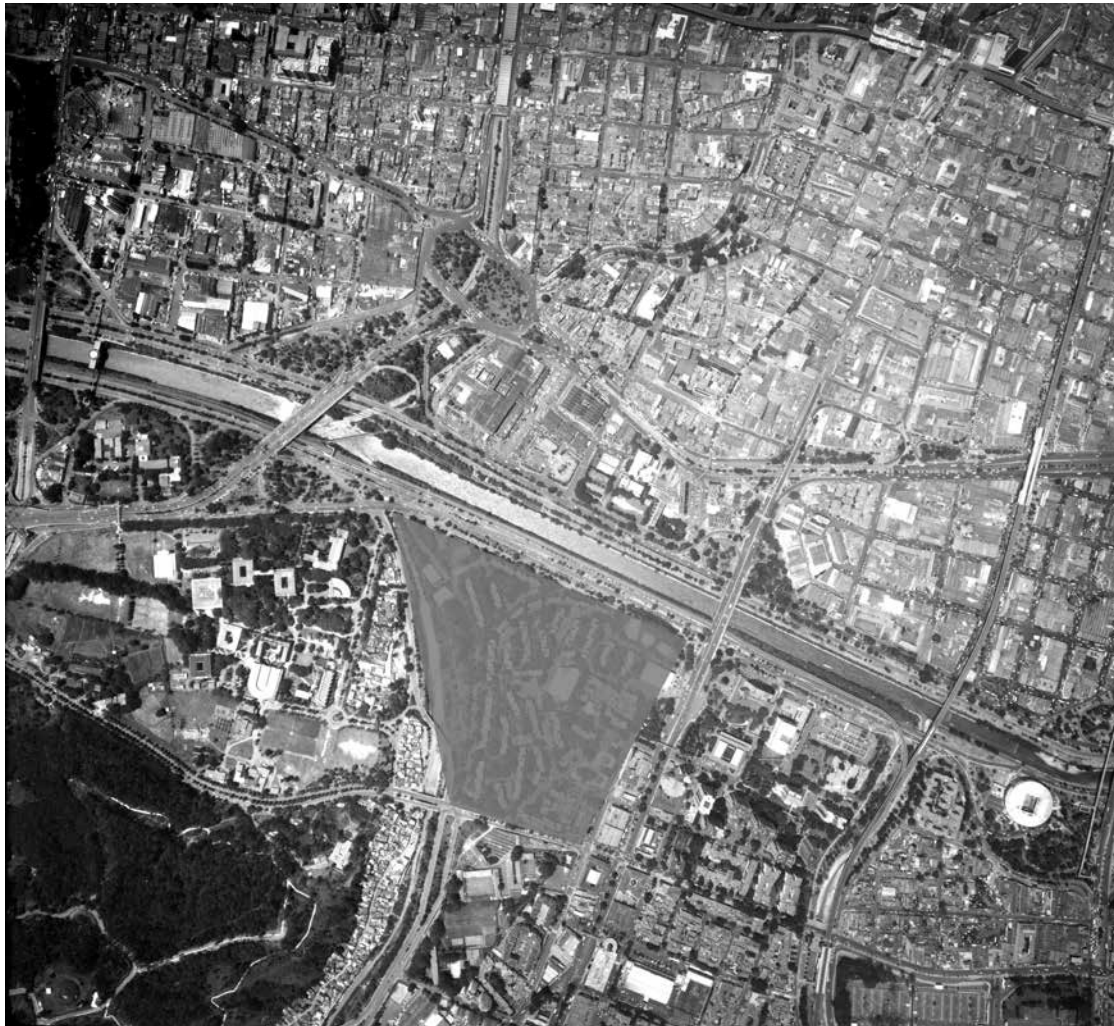
Imagen 7. Detalle Fotografía aérea Medellín. Barrio Carlos E Restrepo.