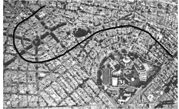
Imagen 6. Detalle Fotografía aérea Medellín. Barrio Laureles - Los Libertadores (hoy San Joaquín).