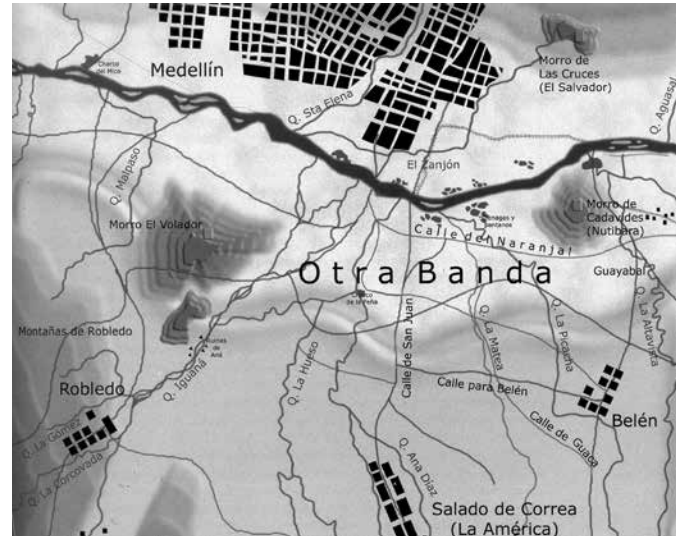
Imagen 2 Detalle Reconstrucción de la "Jurisdicción de la Villa con sus Sitios. Siglos XVII - XVIII".