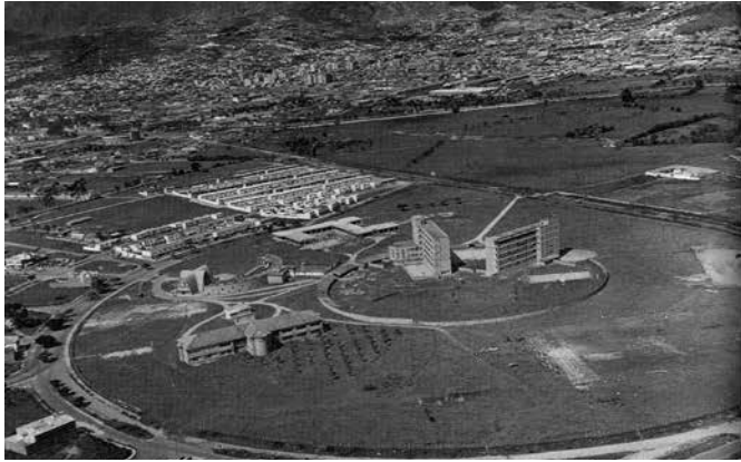
Imagen 5 - Panorámica UPB - Barrio San Joaquín. Gabriel Carvajal. 1953