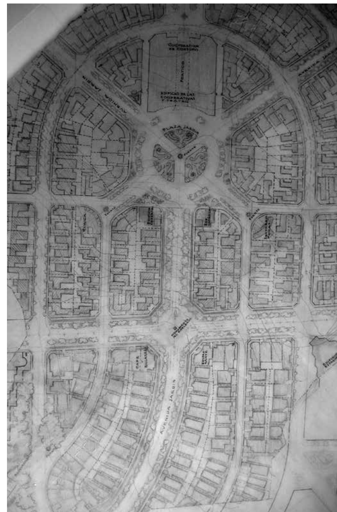
Imagen 4- Plano Anteproyecto Ciudad del Empleado (1939)