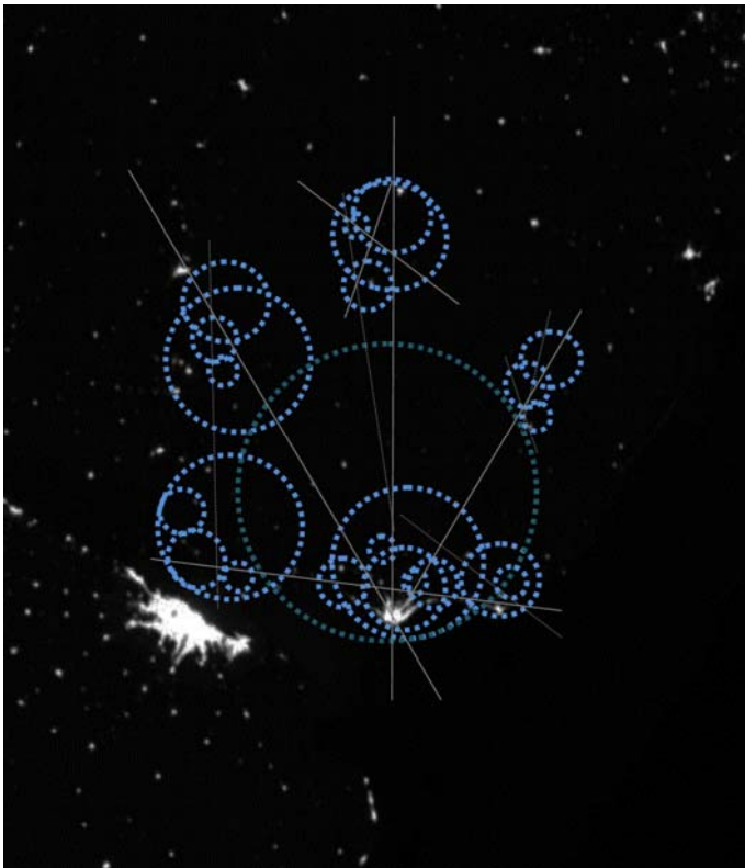
ESQUEMA 1 _ Constelaciones Urbanas en el territorio del Uruguay Construcción propia