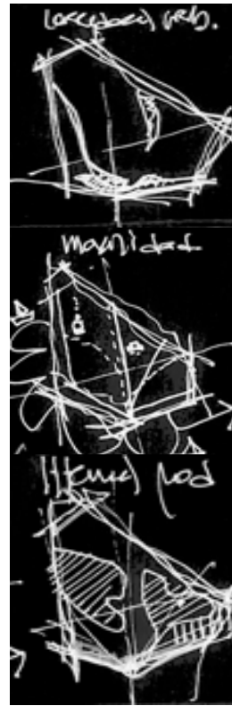
ESQUEMA 2_ componentes estructurales en la construcción de las Constelaciones Urbanas (corredores urbanos, movilidad y sistemas productivos). Construcción propia

La tesis se plantea, por tanto, explorar la lectura del territorio constelado. Construir la herramienta y verificar la operatividad del concepto en sí mismo, buscando indagar sobre la configuración relacional del territorio, su forma y organización.