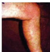
Fig. 3. Foto tomada de Gary Winston, 2010, donde se observan alteraciones cutáneas luego de una exposición a cianobacterias (18).

La Figura 3 muestra inflamación cutánea con eritema ampollado y descamación dentro de las 12 hs. a partir de la exposición a un florecimiento cianobacteriano con presencia mayoritaria de Lyngbia sp. Es una de las más comunes afecciones que sufren cientos de personas todos los años al bañarse en aguas con florecimientos y que refieren picazón y enrojecimiento de la piel más evidente en las zonas donde ajusta la ropa. Este tipo de afecciones se atribuyen a los lipopolisacáridos (LPS) de la pared celular de las células de las cianobacterias, fundamentalmente al Lípido A, sin embargo hasta ahora no hay en la literatura científica suficientes datos como para sustentar esta idea tan ampliamente distribuida (18).