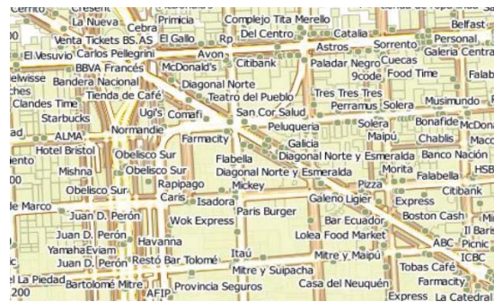
Fig. 3. Sección del mapa utilizado en los experimentos.

Las consultas se ejecutaron utilizando la solución trivial planteada anteriormente y el MeTree y se compararon sus resultados. Ya que tanto la función de distancia métrica como la operación de intersección de dos elementos geométricos suelen ser costosas, se tomó como medida de comparación la cantidad de elementos candidatos resultantes sobre los cuales se hace la comprobación secuencial de ambos aspectos. Los resultados obtenidos para cada una de las consultas se muestran en la Fig. 4.