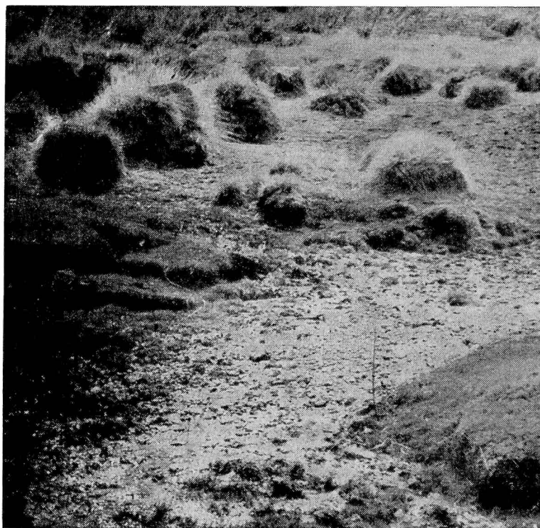
Fig. 3 - Vega donde se halló la Pleurodema bufonina en el Choique.

gónica, así como la describen Castellanos y Perez Moreau (4) y Cabrera (5), por el sur de Mendoza, a lo largo del macizo de Payún, hasta una altura que debe determinarse por el este, teniendo como límite por el oeste la provincia andina (6). Su alcance norte, prolongándose en forma de faja, no ha sido aún bien fijado, según Cabrera llegando hasta los límites políticos entre Mendoza y San Juan, pero según Ruiz Leal adentrándose también en aquella provincia (7). Elementos florísticos significativos han sido citados en el "Colliguay" ( Colliguaya integerrima ), en Grindellia chiloensis , Cassia arnottiana , Prosopis Ruiz Lealii , Pantacatha Ameghinoi , Schinus Roigii , Ephedra ochreatea , Junellia ligustrina , J. Echegarayi , Senecio Covasi , S. psammophylus Grisebachii , Hieronymi , Mulinum spinosum , Cortaderia araucana , etc. Interés especial revisten entre ellos plantas como Anarthrophyllum rigens , Prosopis Ruiz Lealii , Neosparton aphyllum y N. ephedroides , Orobanche chilensis , etc. cuyos límites de dispersión acentúan de una manera muy clara la evidencia de una prolongación cordillerana de la provincia flo-