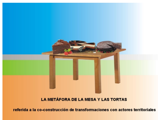
Figura 3: Inteligencia Territorial latinoamericana.

Concebimos las políticas públicas co-construidas en democracias más democráticas que las dominantes, con las “cuatro patas de la mesa” de la Inteligencia Territorial latinoamericana, así como de manera más horizontal. Tres patas referidas a los pilares de la regulación en Max Weber: instituciones públicas, comunidades y mundo empresario; mientras que la cuarta pata refiere a la justicia cognitiva, básicamente con una ciencia inscripta en un paradigma emergente . La tabla de la mesa es el ambiente. Según nuestra perspectiva el territorio -básicamente una coconstrucción y codestrucción social-natural y natural-social- es el conjunto de las patas y la tabla. Las tortas son los proyectos que elige el colectivo: sus capas son la paciencia para ir co-construyendo transformaciones a partir de muchísimas micro-transformaciones, micro-logrps y micro-fracasos incorporando amor, poder y miserias. Los colores de fondo refieren a las cuatro aristas de nuestra Perspectiva EIDT: sujetos, objeto-proyecto-proceso, métodos y técnicas, y sueños, proyección, transformación.