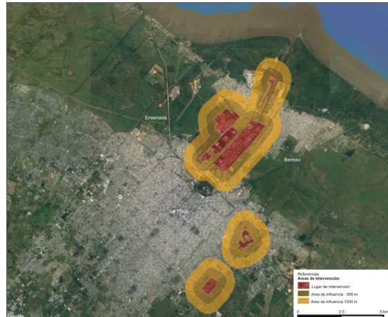
Figura 2. Zonas de los tres objetos de intervención y transformación.

de una emergencia regional, tema general de la convocatoria PIO. Las tres iniciativas pretenden superar la crítica y la resistencia tan frecuentes y necesarias en un mundo científico que combate el statu quo imperante propio del capitalismo, para referirse a la transformación . Se trata en resumen de transformar las urbanizaciones informales (1), mejorar las condiciones ambientales y de salud en zonas industriales (2) y reforzar las áreas suburbanas con criterios más alejados de la urbanización capitalista (3).