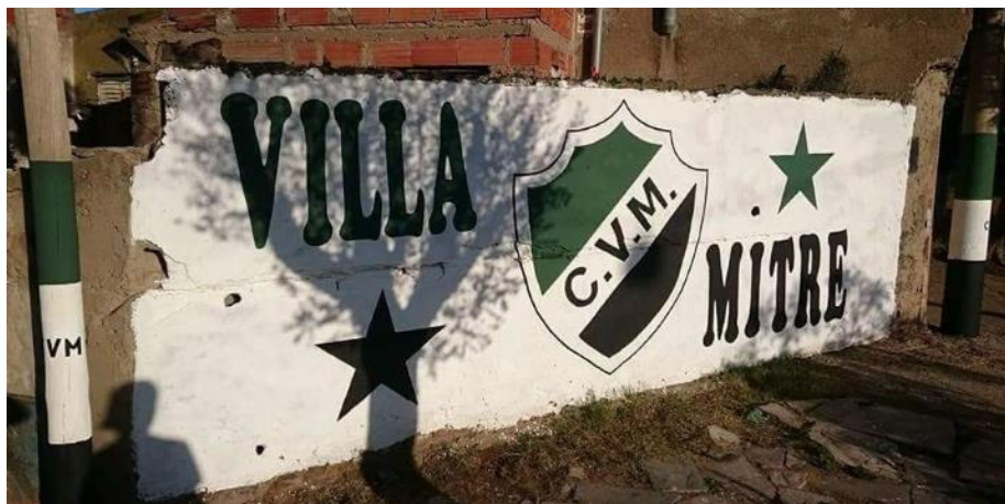
Figura 1. Mural dedicado a “La Gloriosa” (Club Villa Mitre)