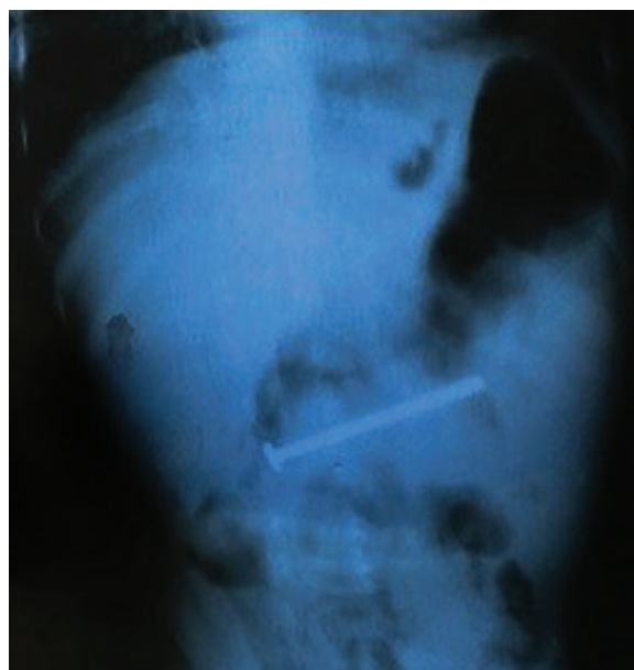
FIGURA 1. Radiografía: Cuerpo extraño radiopaco en la región centroabdominal, compatible con un tornillo

Lactante masculino de 10 meses, que consultó por manifestaciones respiratorias de 3 días de evolución. En el examen físico al momento del ingreso, se constataron signos de hipoxia y obstrucción bronquial y ausencia de otras manifestaciones de importancia. Se realizaron estudios de laboratorio con resultados positivos para el virus sincicial respiratorio y ausencia de elevación de reactantes de fase aguda. Se efectuó el diagnóstico de bronquiolitis. Por la persistencia de las manifestaciones clínicas, se realizó una radiografía toracoabdominal, que mostró infiltrado intersticial bilateral y, como hallazgo, un cuerpo extraño radiopaco compatible con un tornillo de 7 cm de longitud, localizado en la región centroabdominal (Figura 1).