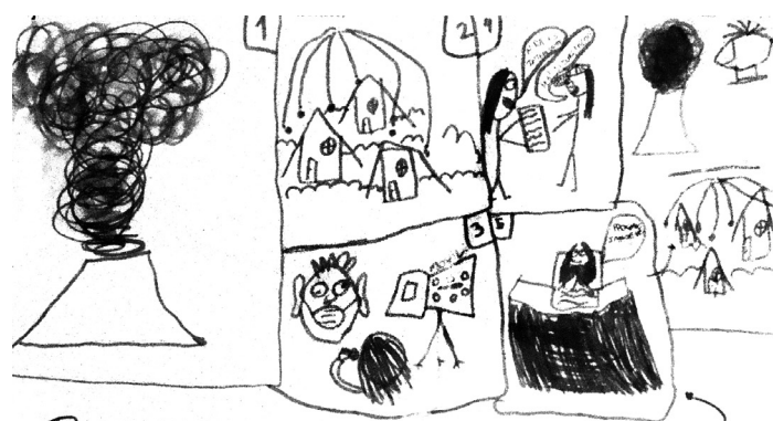
Figura 6 Dibujo grupal con la consigna: ¿Cómo piensan que se producen las noticias?

Primero tiene que pasar algo impactante (como lo de Bariloche) después alguien toma la noticia, luego se la pasan al jefe/a para ver si es interesante, atractivo y verdad, después de ahí van hacia el lugar de la acción o situación. Tal vez hagan una entrevista a algún ciudadano de ahí, para luego pasarla x la medida de comunicación. Y ahí es cuando lo vemos todos.