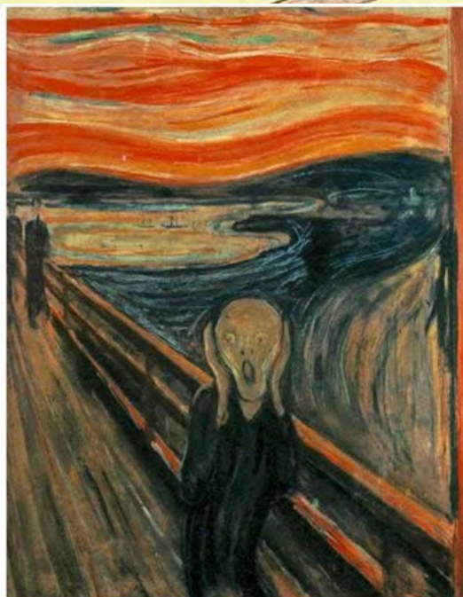
MUNCH, Edvard, “El grito”, Óleo, temple y pastel sobre cartón, 91 x 74 cm, 1893.