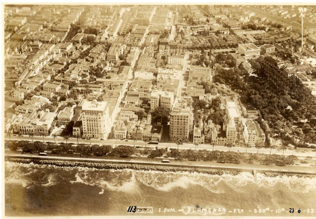
Fig. 2. Edifício Praia do Flamengo (esquerda), foto de 1933.