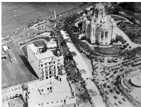
Fig. 1. Palacete Lafont (esquerda) Palácio Monroe direita)