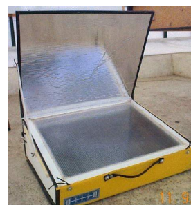
Figura 4: Cocina solar de tipo caja.

Finalmente los chicos presos realizaban la elaboración de un informe de media carilla a una página y media, acerca de lo realizado hasta ese momento.