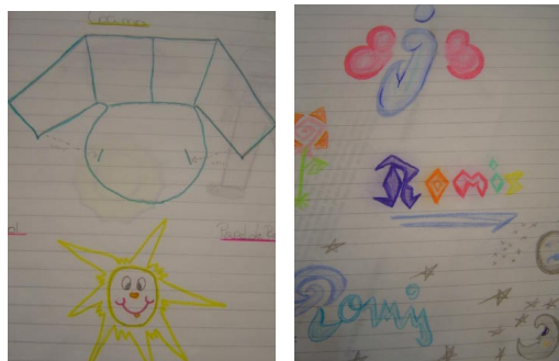
Figura 6: Producción realizada por adolescentes de 16 años.