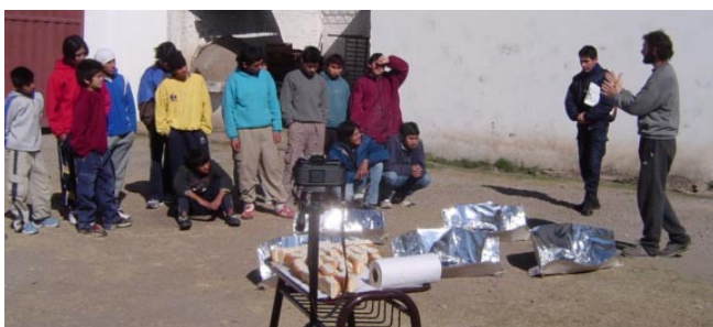
Figura 3: Explicaciones durante un taller de cocción solar.

En una segunda etapa se entregó material para la confección de la mini cocina solar, básicamente una lámina de cartón, papel de regalo reflectante, cinta adhesiva, tijera para el corte y molde para la copia, lográndose el armado de la misma en poco tiempo, como en el caso de los talleres antes mencionados. Con la cocina solar armada, y la provisión de otras, se pudo realizar la experimentación al aire libre, preparándose algunos panchos que luego fueron distribuidos entre los participantes. La figura 3 muestra una fotografía de una de estas circunstancias.