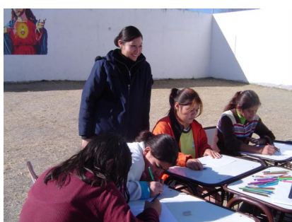
Figura 5: Tarea lúdica al aire libre.

En los talleres subsiguientes se repitió la actividad realizada incluyendo a otros chicos internos de modo de permitir que los que habían realizado el primer taller participaran en la explicación y colaboraran con el armado de nuevas cocinas. En otras oportunidades se llevó a la Comisaría cocinas solares más elaboradas, por ejemplo la cocina tipo caja liviana (ver figura 4) y un conjunto de fotos de las actividades de miembros del Instituto de Investigaciones en Energías No Convencionales (INENCO) realizadas en el campus de la UNSa. Los sábados asoleados se cocinó con las cocinas fabricadas por los chicos que al momento ya llegan a más de veinte. En otra oportunidad las chicas internas realizaron actividades de pintura y expresión escrita al aire libre (figura 5), resultando un trabajo indicativo de sus estados de ánimo (figura 6)