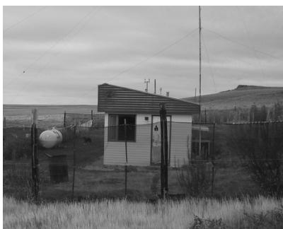
Figura 1: Estación Experimental Potrok-Aike