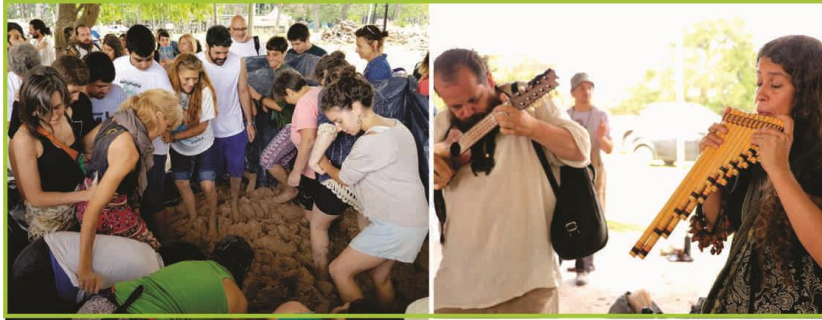
Figura 2. Pisada comunitaria.

En el tercer día, mientras se van terminando de modelar las piezas, se comienza con la construcción participativa del horno. Lo que se destaca aquí, es que en cada una de las ediciones el horno fue elaborado con técnicas diferentes. En la 3ª fiesta, el horno consistía en una cúpula armada con ladrillos uniéndolos y revocándolos con adobe (mezcla de barro y paja). 13 En la 4ª y última edición las piezas fueron mucho más grandes que años anteriores, esto obligo a repensar la manera de cocinarlas. El horno fue construido sin adobe, sino que directamente mediante la superposición de ladrillos distribuidos de manera tal que desde la cámara de combustión el fuego logra envolver las piezas de arcilla colocadas dentro y así alcanzar la temperatura para su adecuada cocción (figura 3).