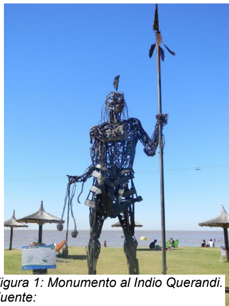
Figura 1: Monumento al Indio Querandí.

Crear un diseño aborigen significa buscar en el pasado para construir el futuro. Es la búsqueda de una estética auténticamente nuestra, para asegurarnos la conservación del arte aborigen y así este forme parte importante de nuestra identidad. Es nuestra tarea no solo sacar a la luz a las distintas culturas regionales sino también darles nueva vida, ligándolas al presente, reelaborándolas y dándoles