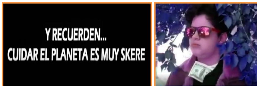
Figura 6. Captura de pantalla del Video N°4. Frase utilizada por los/as estudiantes al finalizar el video. Se traduce skere como "vamos a conseguirlo".