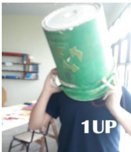
Figura 4. Captura de pantalla del Video N°2. Alumno representando al “superhéroe” del reciclaje” gana una vida (1up).