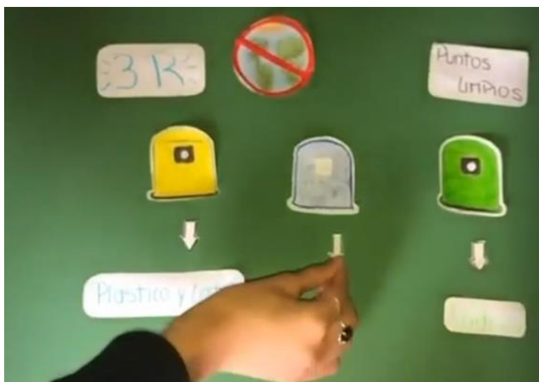
Figura 7. Captura de pantalla del Video N° 5. Explicación de los puntos limpios con dibujos realizadas por los/as estudiantes.