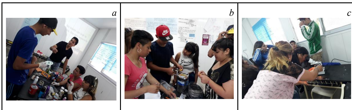
Figura 2. Desarrollo del taller “De la basura a la huerta”. a: Estudiante del Profesorado de Física intercambiando ideas con estudiantes secundarios durante el desarrollo de la actividad de clasificación de residuos. b: grupos de estudiantes secundarios durante la elaboración de microcompostaje. c: Estudiante del Profesorado de Ciencias Biológicas guiando la observación mediante lupa de organismos descomponedores.

lupas de organismos descomponedores; la elaboración de compost para enriquecer la huerta orgánica de la institución escolar; la lectura crítica y el debate sobre cuestiones legales y de impacto económico en la sociedad; la observación de fotografías y videos, así como la elaboración de materiales de divulgación para concientizar a la comunidad a través del diseño de folletos y el armado de una gacetilla para la radio escolar.