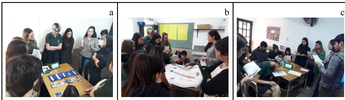
Figura 3. Desarrollo del taller “Bajando los humos”. a: intercambio de ideas acerca de la cadena de comercialización del cigarrillo. b: puesta en acción de un simulador fuma cigarrillos. c: Intercambio de ideas sobre la legislación vigente en torno al consumo de tabaco.

Al culminar la implementación de los talleres se les solicitó a los/as docentes en formación que completaran una encuesta de opinión anónima y en formato on line. Dichas opiniones se describen en el siguiente apartado.