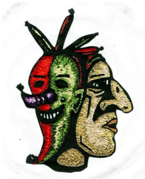
Ilustración 6 Dibujo bordado en tela