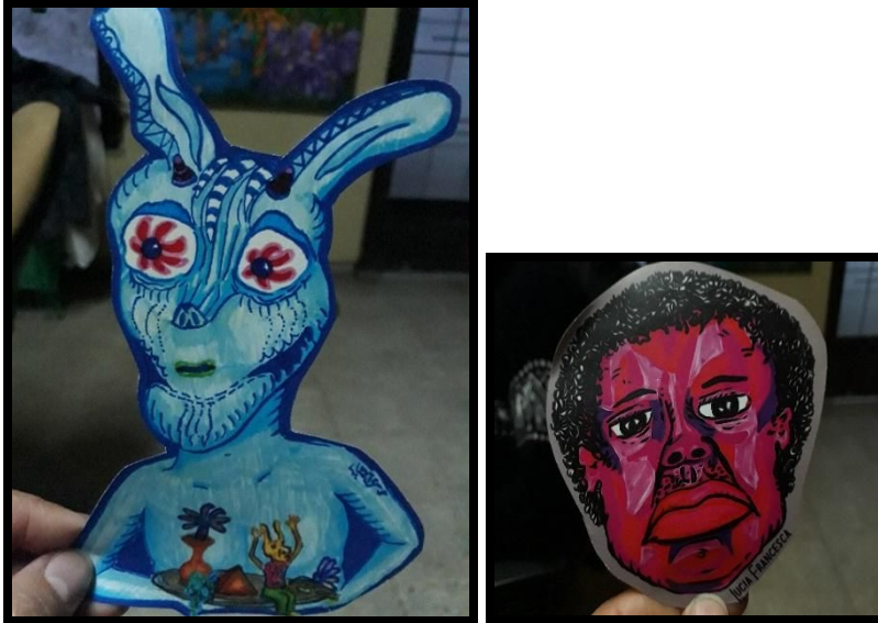
Ilustración 2 Stickers

En tercer lugar, se montará una serie de “Cabezas híbridas” pintadas. Ésta