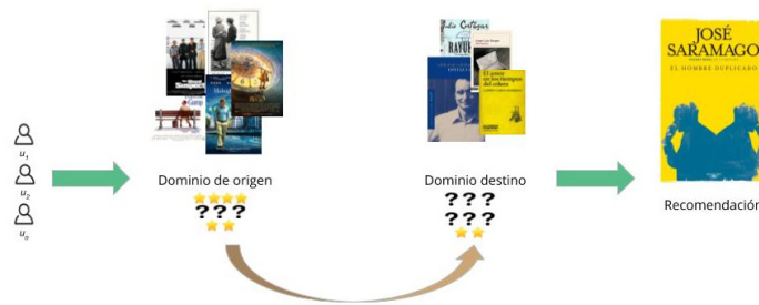
Fig. 1: Esquema: SR multi-dominio