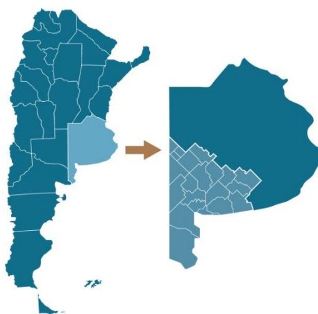
Fig. 1. Localización del área de estudio: Sudoeste Bonaerense. (Elaboración propia)

El Sudoeste Bonaerense (SOB, Figura 1), región de estudio del presente trabajo, no escapa de dicha problemática ya que tiene como principal actividad económica la producción agropecuaria, que genera permanentemente envases vacíos de fitosanitarios, siendo ésta una problemática que sólo se ha tratado de manera aislada y poco eficiente en los distintos municipios.