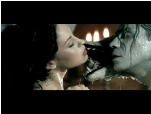
Dracula de Bram Stoker, Coppola (1992)