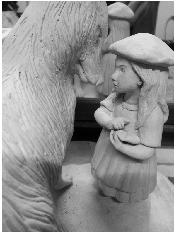
Work in progres

Comencé el proyecto buscando imágenes, ilustraciones, fotos, películas, esculturas de otros artistas, todo lo que pudiera ayudarme en la composición y recursos utilizados. Cada pieza la modelé en arcilla.