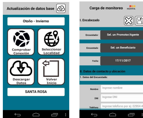
Fig. 1. Pantallas de ejemplo de la App de monitoreo

naciones de ProHuerta, Extensión, Proyectos Territoriales, directores, etc). La aplicación se ha utilizado exitosamente en la provincia de La Pampa durante los años 2017 y 2018. Está planificado extender su uso a la provincia de San Luis.