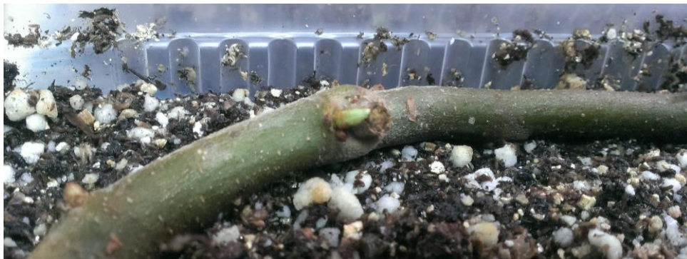
Imagen 6: Rama de F. pennsylvanica con un brote en Forced-Flushing

Se implementó la técnica Forced-Flushing (Meier-Dinkel, et.al; 1993) empleada para forzar la aparición de brotes adventicios a partir de yemas. Se colocaron estacas de 1cm. de diámetro y 15-20 cm. de largo en forma horizontal sobre una mezcla de sustrato (40% turba, 40% perlita y 20% vermiculita) y en bandejas ( Imagen 6 ). Las estacas se rociaron una vez por semana con fungicida Kasumyn comercial y una solución de 300 ppm de citocininas.