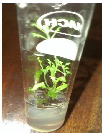
Imagen 14: Plántula in vitro de A. seriphioides

Las semillas de Tomillo del campo germinaron luego de una semana de siembra in vitro , ( Imagen 14 ). El porcentaje de germinación fue bajo, solo un 2-4% de las semillas germinaron bajo las condiciones testeadas. Los posibles motivos de tan bajo porcentaje pueden deberse a la presencia de aceites aromáticos, que resultan oxidantes en el cultivo in vitro . González et al. (2016), marcan la presencia de los siguientes compuestos en el Tomillo del campo, variando su presencia/ausencia y grado de aparición según la procedencia: gamma terpineno - p-cimeno - timol – carvacrol, geraniol - linalol, limoneno - carveol - carvona - cis y trans dihidrocarvona. Otra de las posibles causas puede ser que la especie presente un bajo poder germinativo, para aseverar esto deberían realizarse test de cloruro de 2,3,5-trifeniltetrazolio.