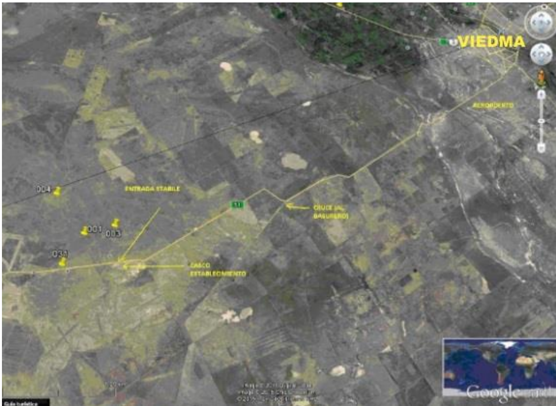
Imagen 1. Puntos donde se tomaron las muestras de Acantholippia serphioides .