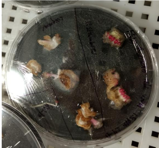
Imagen 12: Formación de callos en explantes de Ceiba sp.

El uso de botones florales para inducir ES es poco común, pero se utiliza mucho para la propagación de cacao. Así, por ejemplo, Urrea Trujillo et al. (2011) indujeron ES a partir de explantes florales en dos clones de Theobroma cacao . La ES de palo borracho aún no ha sido reportada, por lo que este estudio exploratorio podría llevar al ajuste de un protocolo a partir de un explante no utilizado comúnmente en micropropagación.