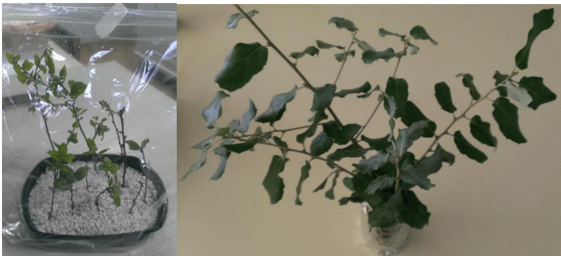
Imagen 9: A la izquierda, estacas en Forced-Flushing. A la derecha, estacas en solución.

con mezcla de 6-BAP en una concentración de 1ppm y ANA en la misma concentración, en agua destilada ( Imagen 9 ).