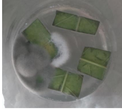
Imagen 11: Explantos de F. pennsylvanica contaminados.

La contaminación de los explantes es algo común en CTV. Fuentealba Jara (2016), encontró que en el cultivo in vitro de yemas axilares de Orites myrtoidea , las mismas presentaron 100% de contaminación a los tres días de establecer el cultivo además de presentarse oxidación en todas las yemas. En relación al cultivo de hojas de Orites myrtoidea y Maytenus chubutensis , todas presentaron necrosis (Fuentealba Jara, 2016)