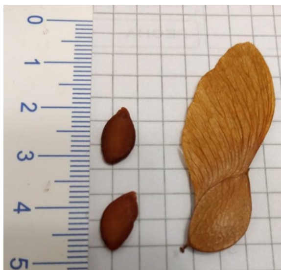
Imagen 4. A la izquierda, semillas de Pterogyne nitens limpias. A la derecha, fruto sámara.

Desinfección: Se siguió el protocolo citado por Molina et al. (2015) que consiste en la desinfección superficial de las semillas mediante lavado en una solución de detergente y agua en agitación a una velocidad de 250 rpm durante 30 min, enjuagándose con agua corriente; posteriormente, una inmersión en alcohol etílico al 70 % (v/v) durante 2 min, seguida de inmersión en una solución de hipoclorito de sodio (NaOCl) al 10 % (p/v) con el agregado de tres gotas de Tween 20® por litro de solución durante 10 min.