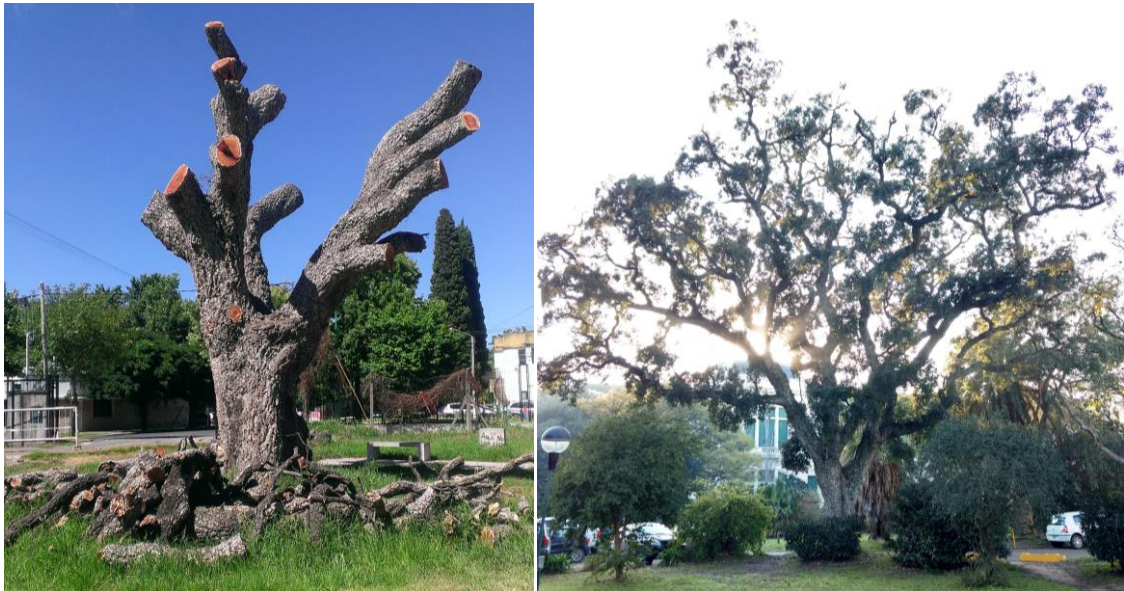
Imagen 8: A la izquierda: ejemplar de la Facultad de Periodismo. A la derecha: ejemplar del Jardín de la memoria.

Etapa 0: las planta madres fueron dos árboles adultos en la ciudad de La Plata ubicados uno en el jardín de la memoria sito entre las facultades de Ciencias Veterinarias y Ciencias Agrarias y Forestales, y otro en la Facultad de Periodismo y C.V. de la UNLP ( Imagen 8 ).