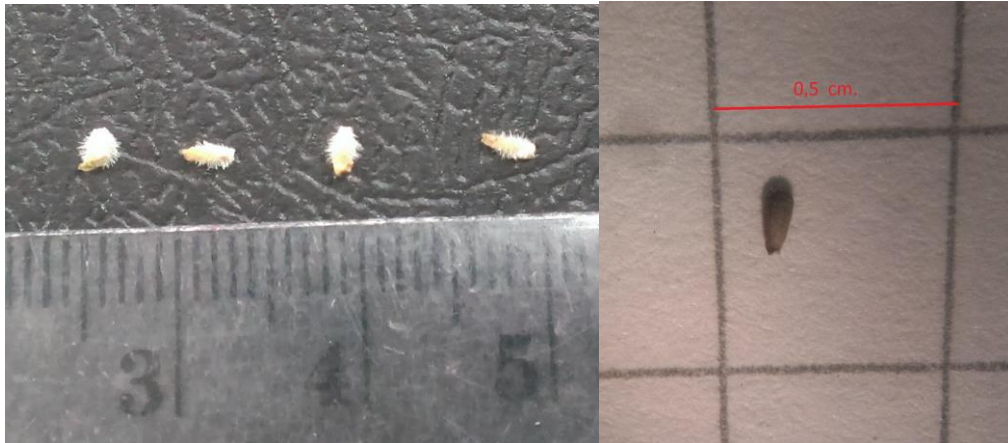
Imagen 10: A la izquierda, cápsulas con semillas de A. seriphioides. A la derecha, semilla limpia, sin cápsula.

encuentran vanas o secas y se utilizaron las que presentan colores verdosos. Estas semillas fueron acondicionadas mediante la remoción de cápsulas, a mano y con pinzas. Una vez las semillas estuvieron listas se procedió a realizar la desinfección propiamente dicha.