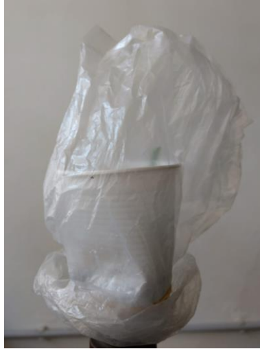
Imagen 2. Plántula en rusticación en vaso de plástico con sustrato y bolsa que conserva la humedad.

Una vez transferidas las plántulas al sustrato se colocaron en mesadas del laboratorio con luz natural que atraviesa las ventanas.