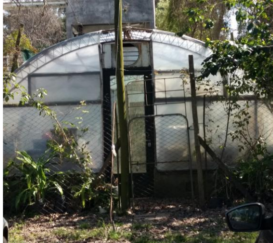
Imagen 5: Invernáculo de Dasonomía, FCAyF, UNLP.

Se implementó la técnica Forced-Flushing (Meier-Dinkel, et.al; 1993) empleada para forzar la aparición de brotes adventicios a partir de yemas. Se colocaron estacas de 1cm. de diámetro y 15-20 cm. de largo en forma horizontal sobre una mezcla de sustrato (40% turba, 40% perlita y 20% vermiculita) y en bandejas ( Imagen 6 ). Las estacas se rociaron una vez por semana con fungicida Kasumyn comercial y una solución de 300 ppm de citocininas.