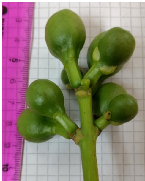
Imagen 7: Botones florales de Ceiba sp.

Etapa 1: como explante se utilizaron los botones florales cerrados, recolectados en el mes de marzo de 2018 ( Imagen 7 ).