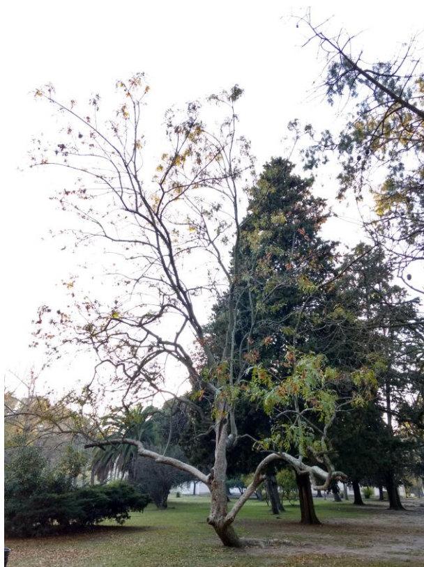
Imagen 3. Ejemplar adulto de viraró, fuente de semillas.

Etapas 1: como explanto se usaron semillas limpias . Se descartaron los frutos vanos o vacíos. De los frutos seleccionados para la propagación se extrajo el material seminal quedando la sámara por un lado y las semillas por otro ( Imagen 4 ).