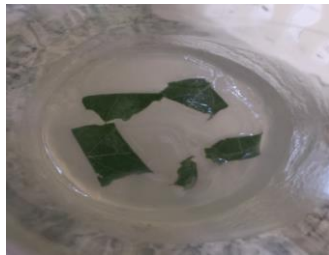
Imagen 13: Explantes luego de la siembra.

concentraciones iónicas, como los de Sommer y Heller, han mostrado ser más adecuados para el crecimiento y proliferación de los explantos leñosos. La presencia de citoquininas (Bencil adenina) es necesaria en esta fase. La adición de auxina (ácido naftalen-acético ) mejora la tasa de multiplicación, especialmente en material de origen adulto. Es por esto, que aún continúan los trabajos para lograr establecer in vitro explantes de árboles maduros (de ejemplares históricos) de alcornoque.