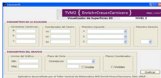
Figura 3. Pantalla del aplicativo

El uso del aplicativo, favorece la comprensión de los conceptos específicos de geometría que se desarrollan por cuanto obliga a establecer, en un entorno gráfico amigable, los valores de las constantes canónicas, especificar las potencias de cada variable, asignar los signos de cada uno de los términos, establecer las coordenadas del centro o del vértice, así como el valor del término independiente. De este modo, visualizan las modificaciones de la forma a partir del cambio de los parámetros de la ecuación. Las experiencias realizadas en clase y así como las posteriores actividades de aplicación y diseño propuestas, evidencian los niveles de comprensión alcanzados. El aplicativo permite modelar las envolventes del objeto que se desea estudiar y/o diseñar, generar gráficos con hasta 20 superficies diferentes, graficar sólo aquellas seleccionadas, establecer sus cotas, destacar sus intersecciones, asignar colores a cada una y guardar en disco el proyecto realizado.