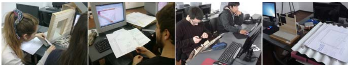
Fig. 4: Vistas de una clase de cálculo de la transmitancia.