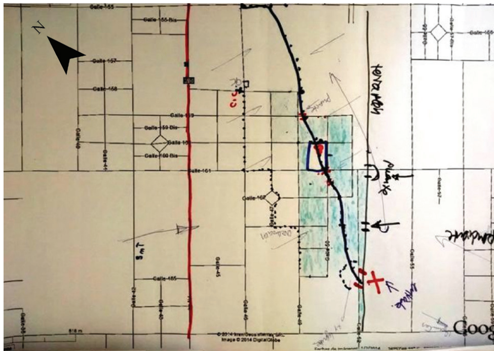
Figura 3. Mapa del barrio realizado por los habitantes del barrio “El Retiro”.

a la inseguridad. Durante las entrevistas, aparecieron como riesgosos aspectos “liminares” como la ausencia de redes formales de cloacas y de agua potable, que evidentemente tienen un aspecto biológico, pero que tomaban también la forma de reclamo a la dirigencia política.