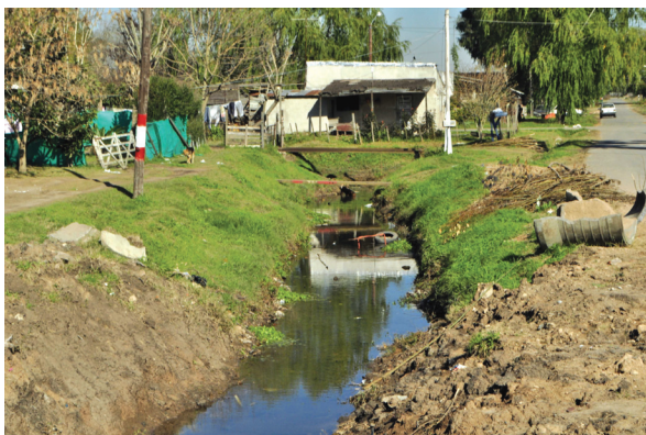
Figura 2. El arroyo Pérez atravesando el barrio El Retiro.

La población alcanza los 2812 habitantes (INDEC 2015) y se encuentra compuesta principalmente por familias migrantes de provincias del interior del país que, desde mediados del siglo pasado se asentaron en el lugar. Además, actualmente hay dos asentamientos pertenecientes a la comunidad gitana. Las instituciones más importantes del barrio son el club Corazones del Retiro y el Centro de Integración Comunitaria (CIC). La primera es una asociación civil que se destacó por las acciones que llevó adelante en los momentos posteriores a la inundación; la segunda es una entidad estatal dependiente del Ministerio de Desarrollo Social de la Nación. Además hay una gran cantidad de comedores comunitarios e instituciones educativas. Ambas márgenes del arroyo Pérez (Figura 2) se encuentran densamente pobladas y presentan, al igual que el lecho, una gran cantidad de basura. El hecho de que las viviendas estén tan cercanas a la vera del curso de agua tuvo consecuencias graves en el momento de la inundación. Cabe indicar que, al no existir un sistema cloacal, los desechos domésticos frecuentemente se desagotan en el arroyo. Por otra parte, el sistema formal de suministro de agua no abarca el total del área de viviendas. Para subsanar esta carencia, los habitantes de El Retiro han tendido una red hídrica informal que complementa a la formal y que incluye a miembros de una misma familia y vecinos cuyas viviendas se ubican entre manzanas.