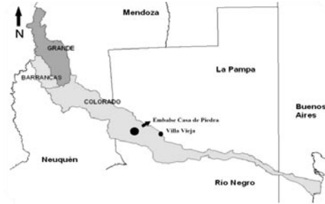
Figura 2. Ubicación geográfica de Villa Vieja (Dpto. Puelén, La Pampa), sitio de muestreo.