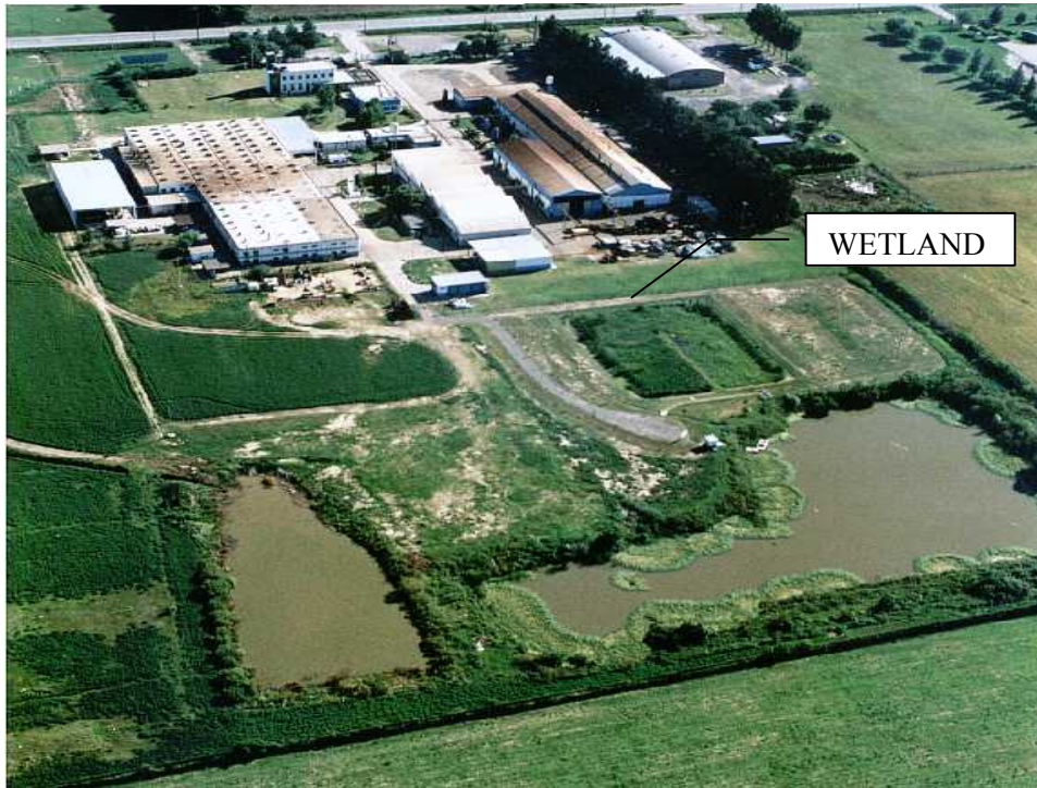
Fig 1: Vista aérea y lateral del wetland.