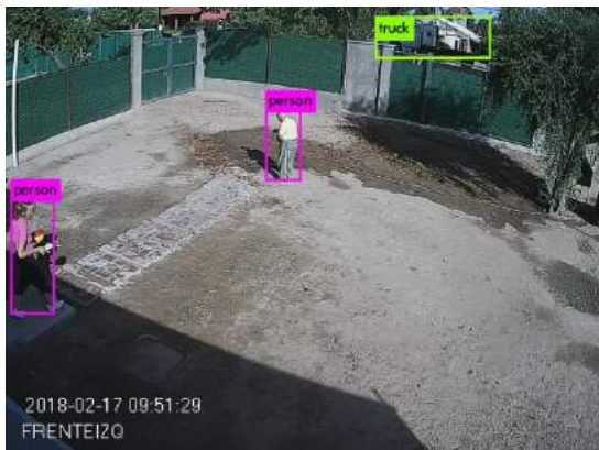
Ejemplo de detección de automóvil y persona