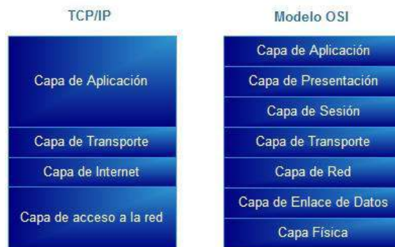
Figura 1: Comparación del Modelo OSI y TCP/IP

Toda la investigación será abordada en relación al modelo OSI y no al TCP/IP, es decir siempre que se mencione los niveles o capas será tenido en cuenta en relación al Modelo OSI, a continuación se expone en la siguiente imagen una comparación entre ambos modelos para su mejor comprensión.