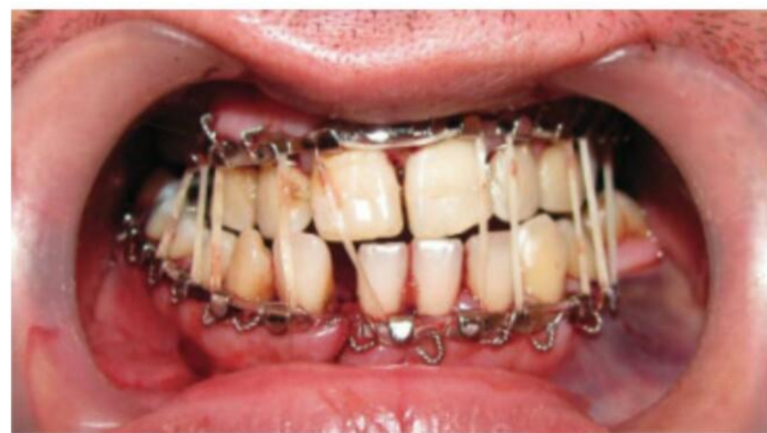
Figura 14. Bloqueo intermaxilar mediante arcos de Erich y elásticos en fractura mandibular.

El tratamiento depende de la gravedad de la fractura. Si se trata de una fractura menor es posible solamente el uso de analgésicos y una dieta blanca y/o líquida. En caso de fracturas moderadas o severas se requiere una cirugía. El manejo inicial de estas fracturas es la estabilización de los segmentos mediante la instalación de arcos dentarios de Erich y bloqueo intermaxilar.