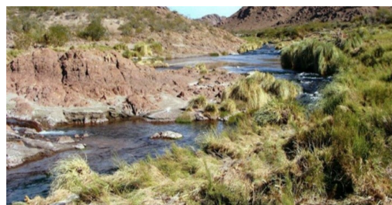
Arroyo Valcheta.

Como la mayoría de los peces óseos, la reproducción de la mojarra desnuda es de tipo ovípara y con fecundación externa. La estación reproductiva comienza en el mes de agosto hasta octubre. El dimorfismo sexual es poco notorio aunque las hembras maduras pueden diferenciarse de los machos por presentar el abdomen más redondeado. Se observó en ejemplares mantenidos en acuario que la puesta se realiza posteriormente a un cortejo de varias horas y una misma pareja puede repetir la operación en un lapso aproximadamente de una a tres horas. Los embriones recién eclosionados permanecen en el fondo adheridos a la grava hasta el comienzo de la alimentación exógena.