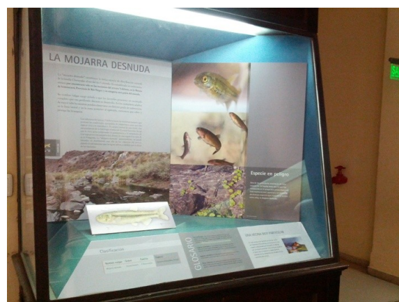
Vitrina Museo de La Plata.

otra parte, la acción del pisoteo del ganado vacuno y caprino en el lecho de los arroyos suma otra importante perturbación en el ambiente. En otro aspecto, la introducción de peces exóticos en la cuenca resulta una amenaza directa para su supervivencia.