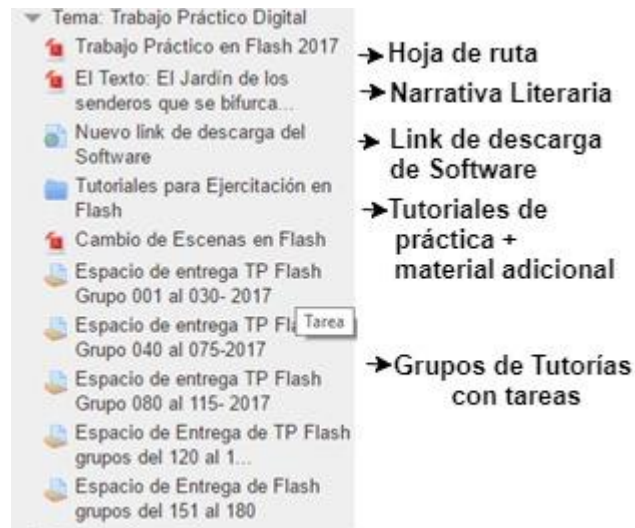
Fig. 5. Materiales, configuraciones de tareas y grupos en el aula virtual