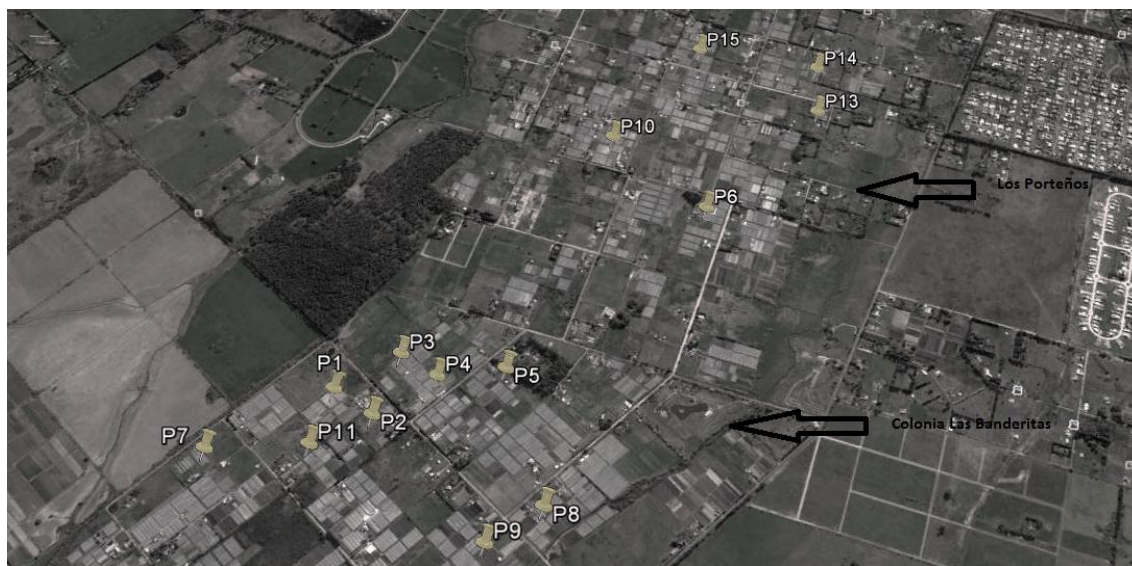
Figura 1. Ubicación de los productores integrantes de los grupos Banderitas y Santa Elena (año 2008).

Una de las características más significativas de los productores integrantes de ambos grupos es que por su cercanía, tipo de producción y hasta origen se conocían desde hace mucho tiempo, incluso algunos por más de tres décadas. Si bien siempre hubo colaboración como vecinos, o una participación parcial en actividades sociales como el Centro de Fomento de Las Banderitas, hasta la conformación de los grupos no se habían integrado en forma asociativa en pos de la mejora de los sistemas productivos. La figura 1 muestra la cercanía entre los productores integrantes de los grupos Banderitas y Santa Elena en las zonas de Los Porteños y Colonia las Banderitas 2 . En la misma se observa también un importante núcleo de producción bajo invernáculos, correspondiendo mayormente a la actividad florícola.