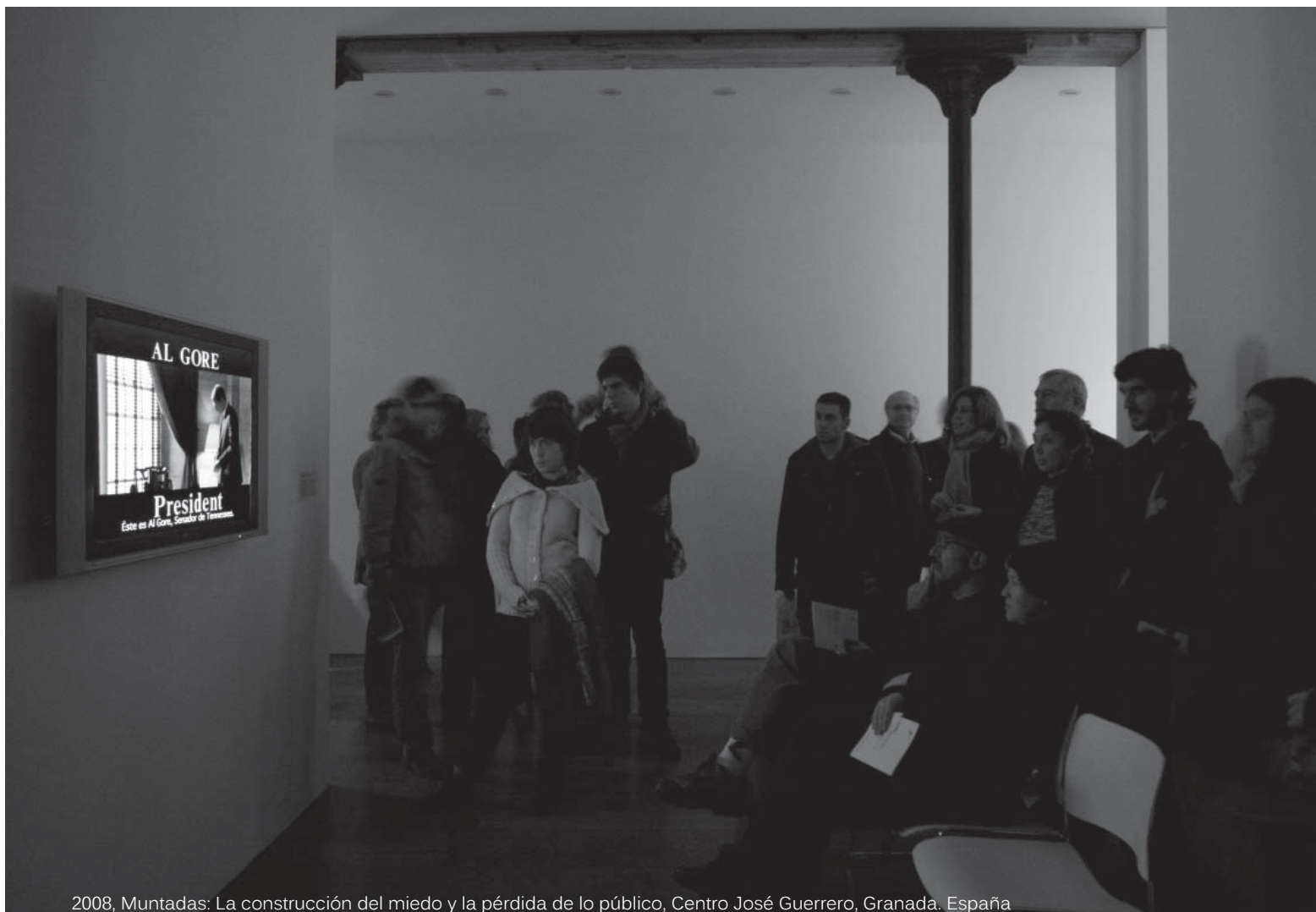
2008, Muntadas: La construcción del miedo y la pérdida de lo público, Centro José Guerrero, Granada. España