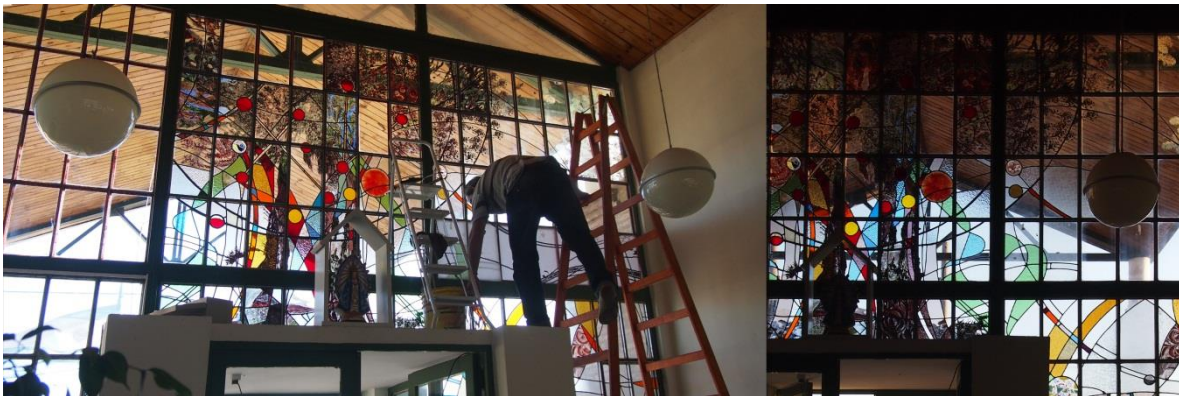
Imagen del vitral "Objeto" Remolino y Pampa, en estado de colocación

La inclusión en este tipo de jornadas sirvió para valorizar la producción del arte en vidrio, las maneras de poner en juego cada concepto y los modos de poner el cuerpo ante la situación. Mutuamente nos incluimos, nosotros incluimos a las jornadas y las jornadas nos incluyeron.