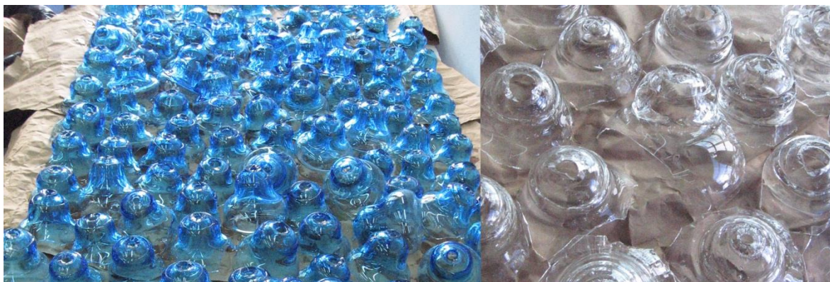
Pedazada proporcionada por la cristalería San Carlos para el Proyecto Adecuación de material vítreo como producto para nuevas aplicaciones.

En el año 2014 tomó forma el proyecto Adecuación de material vítreo como producto para nuevas aplicaciones , cristal San Carlos. El mismo fue el resultado de nuestra presentación a la convocatoria “Amílcar Herrera”, que nos permitía encuadrar en su contexto una investigación que se inició informalmente en el 2011. Para esta presentación ante el Ministerio de Educación a través de la Secretaría de Políticas Universitarias se formalizó aquel trayecto iniciado en el 2011. Desde 2009, como grupo de trabajo, estuvimos construyendo una relación fortaleciendo el vínculo que se inició como un contacto.