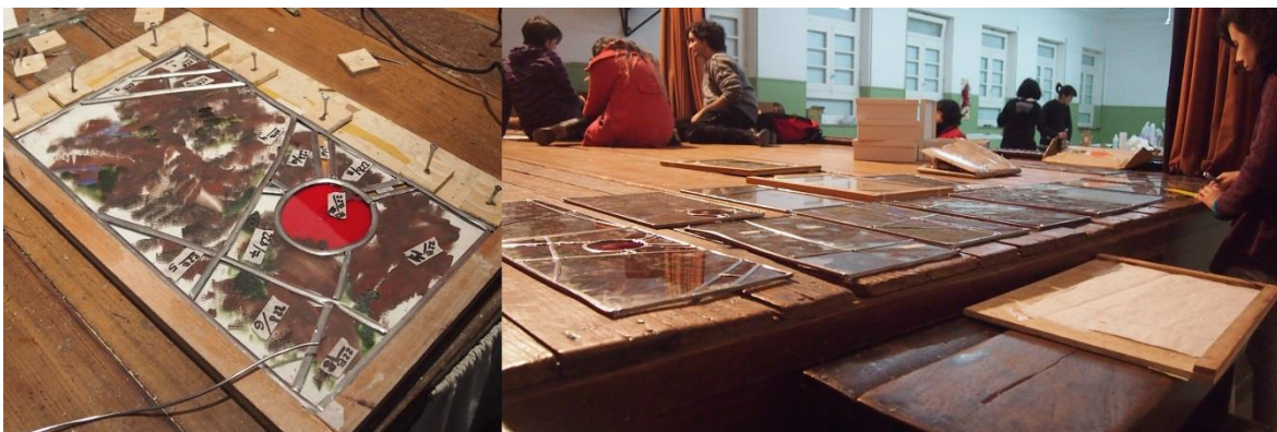
Proyecto “Aventón” Culminación del Vitral “Remolino y Pampa”