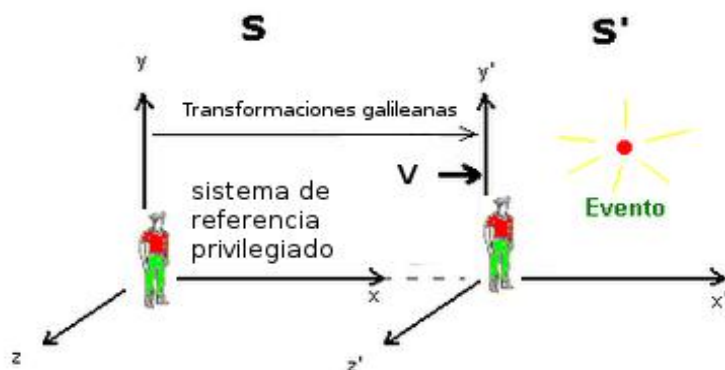
Figura 3. Esquema del modelo escolar o modelo de los alumnos. En este modelo los observadores no se distinguen por que básicamente ven los mismo (los alumnos aducen compensaciones para que los fenómenos no cambien).

En este punto es pertinente preguntarse si las ideas previas reportadas en los artículos antes mencionados son útiles por sí solas para elaborar el modelo de los estudiantes, ya que dichos trabajos no cuestionan a los alumnos específicamente sobre las relaciones de los elementos y sobre las condiciones. Entonces parece pertinente pensar que sería más útil recabar las ideas previas teniendo en mente la visión de modelos y no la de cambio conceptual, a la que están adheridas las investigaciones mencionadas.