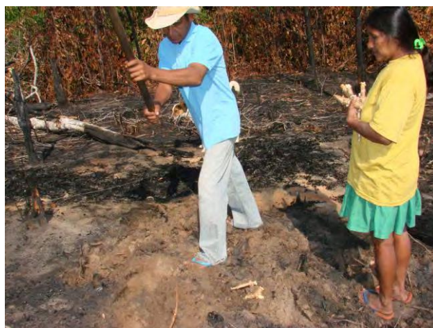
FIGURA 4. Plantio da Manihot esculenta Kratz., agricultura familiar indígena, aldeia Paraíso, povo Paresi, MT.