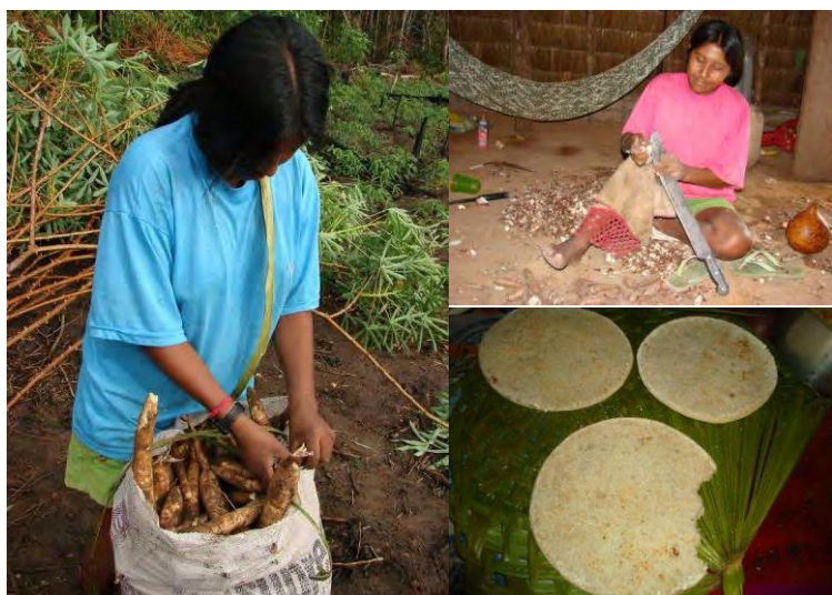
FIGURA 5. Colheita e processamento da mandioca, aldeia Paraíso, povo Paresi, MT.