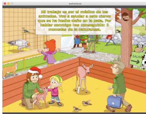
Figura 2. Ejemplo de pantalla del capítulo 1

Algunas pantallas de la interfaz de la aventura gráfica pueden verse en las Figuras 2 a 4.