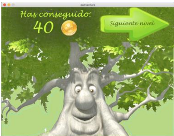
Figura 4. Ejemplo de pantalla de fin de capítulo

El método que más se adapta a este estudio es el método descriptivo, debido a que se adecua más a las actividades al ser necesario explicar y describir lo que los alumnos deben hacer. La metodología empleada para cada grupo es la siguiente: