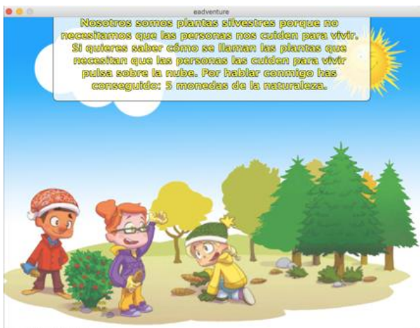
Figura 3. Ejemplo de pantalla del capítulo 3

una alumna con adaptación curricular individualizada no significativa que recibe apoyo en el aula en las materias troncales. El método de enseñanza que sigue su tutor incluye el uso de presentaciones multimedia y actividades en pizarra digital, por lo que resulta más natural introducir el videojuego en esta aula al no ser necesario adaptación a la herramienta. Este grupo se ha seleccionado como grupo experimental para trabajar con la herramienta eAdventure .