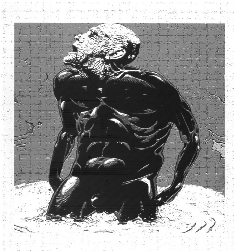
Figura 3. El baño de Caín (2007), Ricardo Cohen. Ilustración

En otras imágenes el estallido en partículas del cuerpo representado se ha sustituido por la proliferación de modos y de recursos dispuestos en un mismo plano temporal. En la figura representada en El baño de Caín (2007) [Figura 3], hay una oposición en el tratamiento de un cuerpo compuesto por músculos marcados que tiene un superficie oscura, lisa y brillante, como de basalto pulido, mientras la cabeza anciana del personaje, blanquecina, apergaminada y rugosa, parece hecha de piedra calcárea, con aspecto poroso.