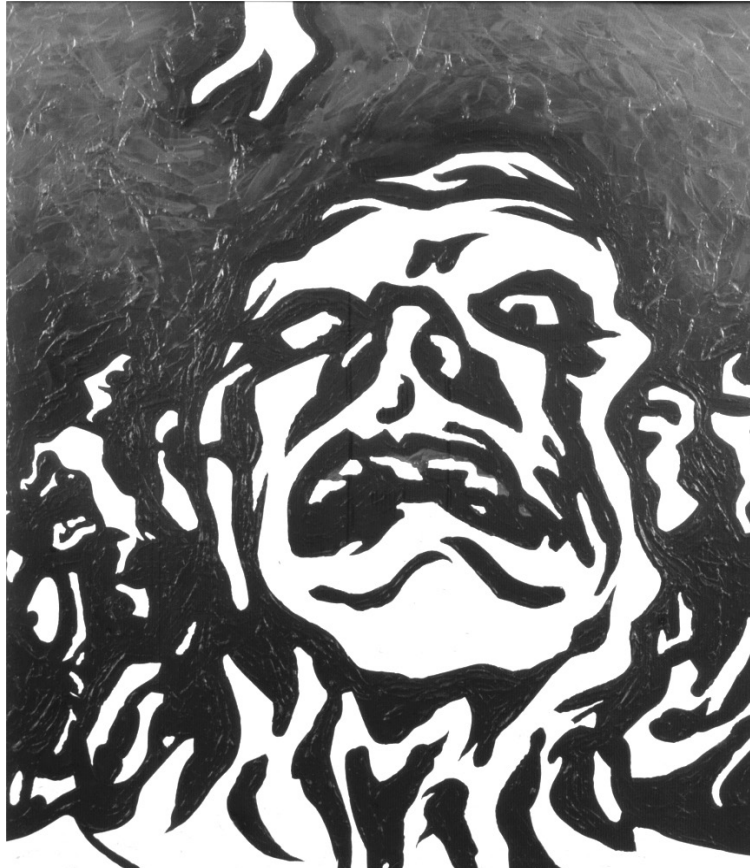
Figura 2. El Caballo (2010), Ricardo Cohen. Acrílico sobre tela. Dimensiones desconocidas

La secuencia de trabajos descritos se podría asimilar a un proceso de descomposición de lo humano. Algunos dibujos antiguos son antecedentes, como La antigua pregunta (1986). En este dibujo las partes constituyentes del cuerpo representado se separan, crecen, se distorsionan y develan en el tratamiento de modelados su peso y la consistencia propia de tejidos diferenciados. Podría ser un antecedente directo del cuadro Memoria , antes mencionado, con la particularidad de poseer de fondo una multitud de figuras que componen una trama, que plantea otra problemática que emerge en algunas obras de Cohen, a saber: la tensión entre lo colectivo y lo individual, a través de la dificultad de integrar sus representaciones. Las partes del cuerpo se hacen extrañas, se autonomizan y los intersticios así liberados dejan que la imagen de la multitud pase como penetra en la constitución de la identidad propia la mirada de los otros.