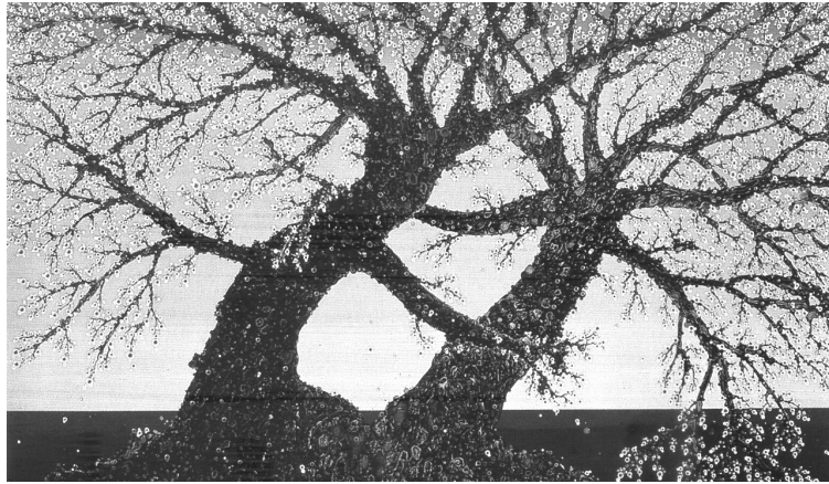
Figura 4. Árboles enamorados (2002), Marcelo Pombo. Esmalte sobre panel. 100 x 150 cm

Estos puntos complejos son una constante en la gran mayoría de sus trabajos a partir de 1993 y son utilizados, en algunas obras, en casi todas las figuras que se oponen a un fondo frecuentemente liso o que presentan otros procedimientos. También aparecen en Árboles enamorados (2002) [Figura 4], visible en los brotes de las ramas, pero los troncos comparten ese tratamiento en otra tonalidad. Aquí, los árboles, que están compuestos por esta textura puntiforme, son los cuerpos de dos amantes.