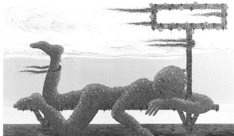
Figura 5. Bodhisattva joven y náufrago (2006), Marcelo Pombo. Esmalte sobre panel. 100 x 150 cm

El pasaje del tratamiento de los árboles hacia la figura humana se verifica después. En una obra posterior, Bodhisattva joven y náufrago (2006) [Figura 5], el cuerpo despreocupado del santo está compuesto en su totalidad por este tratamiento perlado, en modulaciones de tamaño y de brillo, al igual que los tres personajes de otra obra del mismo año, Festival artístico multimedia flotante .