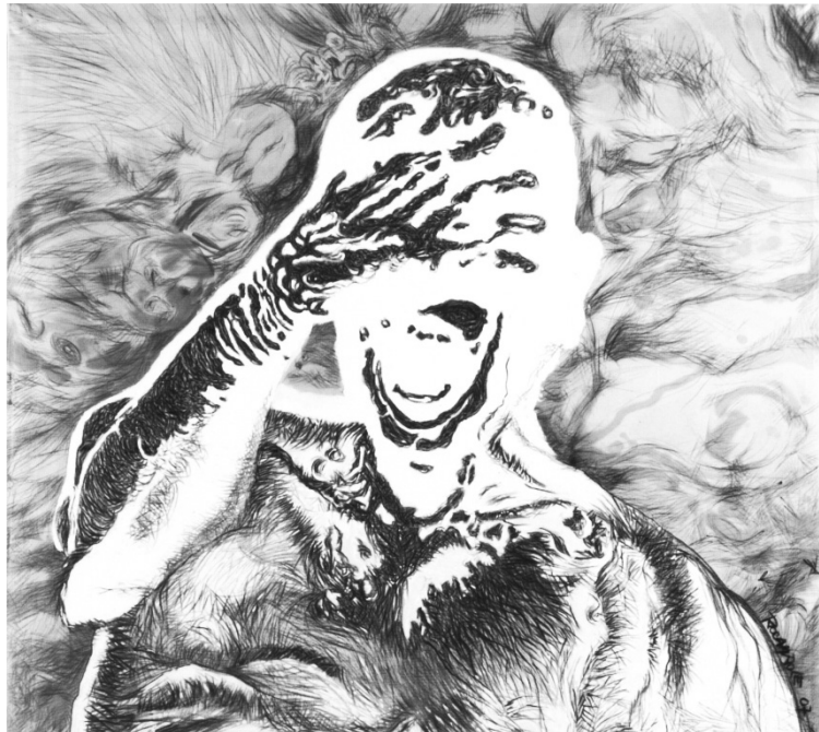
Figura 1. ¿Todavía? (2007), Ricardo Cohen. Acrílico sobre tela. 180 x 180 cm

En 2007 la misma figura retorna en otra clave en la que se explotan las distintas modulaciones del trazo y del gesto, propias del lenguaje del dibujo. La obra se titula ¿Todavía? [Figura 1].