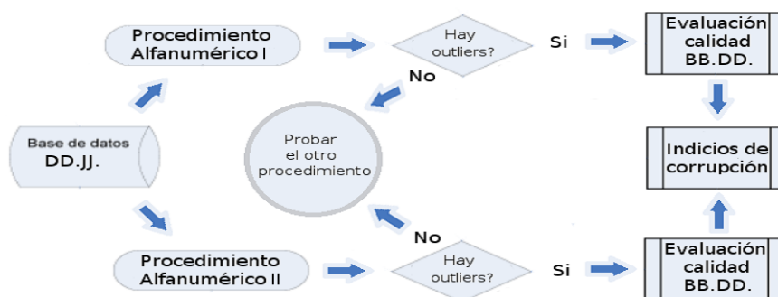
Fig. 4. Propuesta de aplicación de procedimientos híbridos de detección de campos anómalos sobre bases de datos de declaraciones juradas alfanuméricas.[Elaboración propia]

La idoneidad de estos procedimientos híbridos son propuestos como solución tentativa para un caso de contralor civil para la mejora de los datos públicos y cívicos de una población. A continuación se despliega una posible resolución y aplicación hipotética de contralor civil en base a los procedimientos alfanuméricos descriptos, sobre BBDD de DDJJ abiertas previamente tratadas.