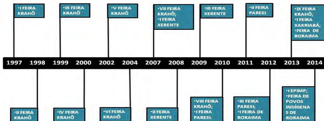
FIGURA 2. Linha do Tempo das Feiras Indígenas no Brasil