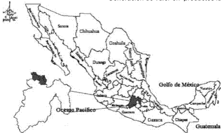
Figura 1. Ubicación de la zona de estudio.

El clima en el municipio se considera templado subhúmedo con lluvias en verano y semifrío en invierno con heladas de noviembre a febrero, se presenta una precipitación promedio de 663,6 mm, una temperatura máxima promedio de 24,3°C, mínima promedio de 2,3°C y promedio de 13,2°C. el municipio cuenta con una superficie cultivable de 35.448 ha, de la cual 15.787 ha son agrícolas, el 20% de estas cuenta con riego y el 80% restante son de temporal, cabe destacar que las condiciones climáticas permiten que se lleven a cabo cultivos como maíz (89% de la superficie agrícola), avena y praderas cultivadas de gramíneas y leguminosas de climas templados, los cuales son utilizados principalmente para la alimentación del ganado productor de leche (Espinoza et al. , 2007).