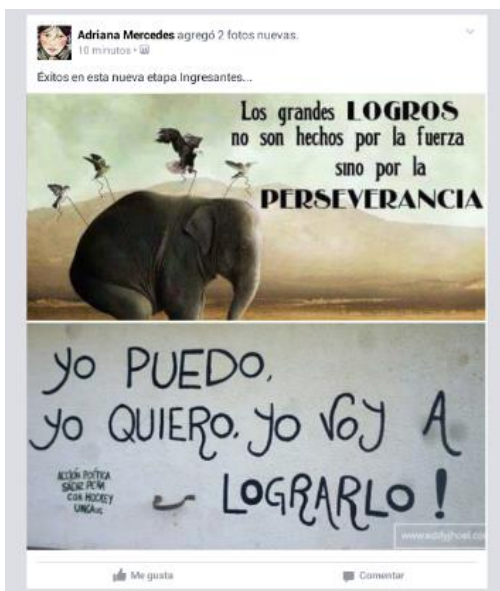
Ilustración 2: Imagen compartida por Facebook

Además de información formal y organizacional se pudo alentar a un inicio exitoso.