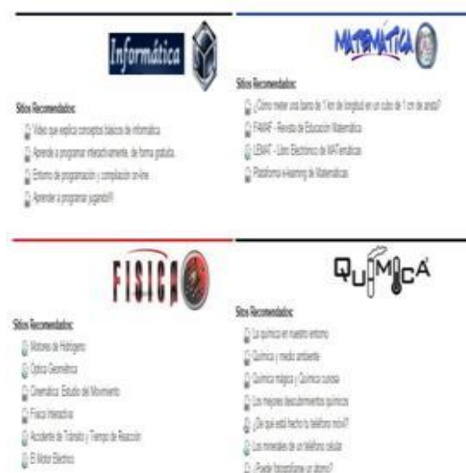
Ilustración 9: Bloque de Informativos

Son bloques donde se colocaron enlaces de interés, relacionados con las distintas áreas de la Facultad de Ciencias Exactas, de esta manera los estudiantes logran interiorizarse sobre alguno de los tópicos que abarca la carrera elegida.