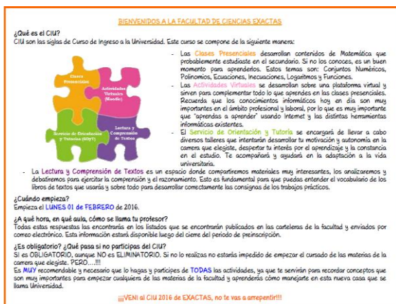
Ilustración 1: Texto Enviado a los Alumnos

Además se propuso la realización de un Trabajo Práctico Inicial, que contenía una serie de ejercicios que abarcaba todos los temas a llevar a cabo en el CIU para que los ingresantes tengan un panorama general del curso. Este práctico debía entregarse en la primera clase al docente correspondiente y sirvió como un diagnóstico previo al inicio del curso. El práctico fue puesto a disposición del grupo de estudiantes dentro del aula virtual del CIU 2016 para fomentar el acceso temprano a la plataforma.