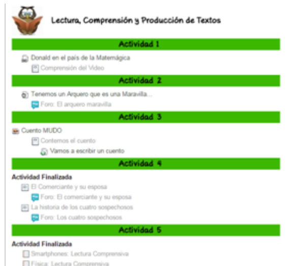
Ilustración 8: Bloque de Lectura, Comprensión y Producción de Textos

A diferencia de las actividades de los bloques temáticos de matemática que se vinculaban específicamente a alguno de los temas desarrollados en las clases presenciales, las actividades centrales de este trabajo buscaban ser una aplicación transversal a esos contenidos.