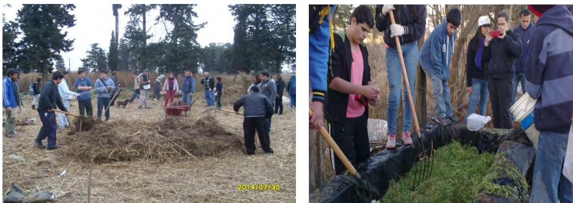
FIGURA 4. Actividades de Control y monitoreo: Izquierda: nueva pila de compost. Derecha: trabajos sobre el lombricario.

Los distintos componentes de la unidad demostrativa pueden cumplir distintas funciones pero también complementarse. Como el digestor se dejó de lado, se analizó usar los efluentes semi digeridos de los depósitos, Estos depósitos no almacenan biogás, pero permiten una digestión anaeróbica mesofílica, no controlada, de los estiércoles. Se encontró un contenido de N muy interesante (0.42 gr./kg) aunque con valores altos de salinidad (6.3 dS/m, que puede deberse a la deriva involuntaria de balanceados), por lo que no se implementó. Se aconsejó su uso para fertilizar las pasturas del área de amortiguación.