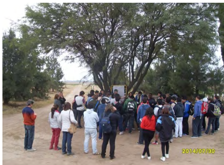
FIGURA 3. Exposición sobre elaboración y monitoreo de compost.

La capacitación de los actores se profundizó a través de jornadas-taller a campo, (figura 3) mediante exposiciones dialogadas seguida de actividades concretas de trabajo, aplicando los conceptos vertidos. Se hicieron varias, referidas a construcción de pilas de compostaje, camas de lombrices, y monitoreo de compost y lombricarios. Las jornadas-taller sirvieron para desarrollar las distintas subunidades planificadas. La unidad demostrativa quedó prácticamente rodeada por el área de amortiguación (figura 1).