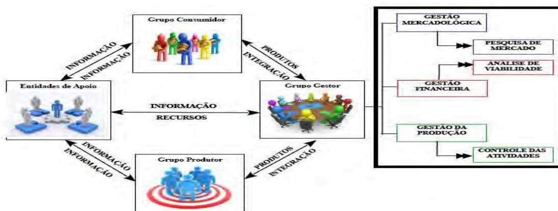
FIGURA 1. Integração e troca de informações dos agentes no Grupo de Compras Coletivas de Alimentos Ecológicos.

Para a consolidação efetiva do grupo de compras coletivas, foram desenvolvidas três atividades principais que estão destacadas na imagem abaixo: Pesquisa de mercado, análise de viabilidade e controle das atividades. A primeira diz respeito principalmente á oferta e demanda. A segunda nos traz a viabilidade de criação do grupo tanto em relação aos preços dos produtos dados pelos e propostos para os agricultores, quanto para os preços propostos pelos consumidores e se poderiam cobrir os custos das atividades no grupo gestor (compra de materiais utilizados). Já a terceira é a que daremos ênfase para a elaboração deste trabalho.