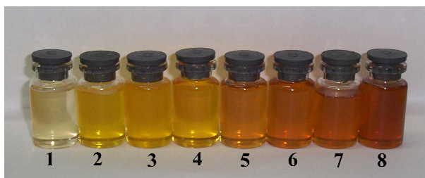
Figura 2. Muestras de miel de diferentes grados de color provenientes de distintas regiones de la Pcia. de Buenos Aires. Colores: blanco agua, 1; blanco, 2 – 4; ámbar extra claro, 5; ámbar claro, 6 y 7; ámbar, 8. Procedencia de las mieles: 1: Pcia. Pampeana, Dist. Oriental; 2 – 4: Pcia. Pampeana, Dist. Austral; 5 – 8: Pcia Paranaense.